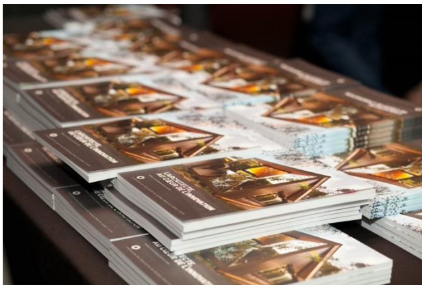
Les Manuels de référence 2015