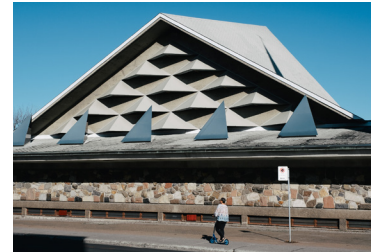
Église Saint-Jean-Vianney, Rosemont