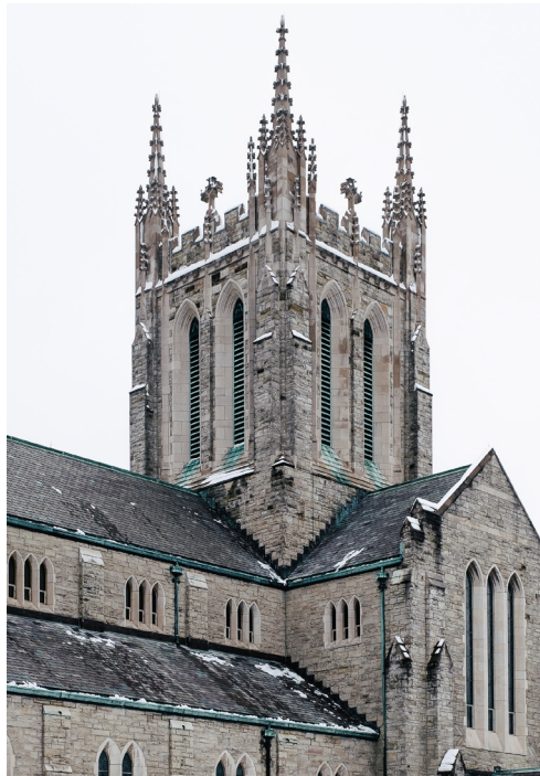
Église Ascension of Our Lord, Westmount

LES ÉGLISES DE MONTRÉAL