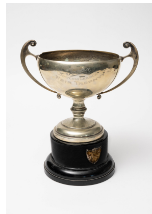
Collection Société historique de Saint-Henri Photos : Paul Litherland