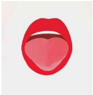
2012.471 Tom Wesselmann (1931-2004), étude pour Mouth #10, 1967. MBAM, don de la succession Tom Wesselmann.