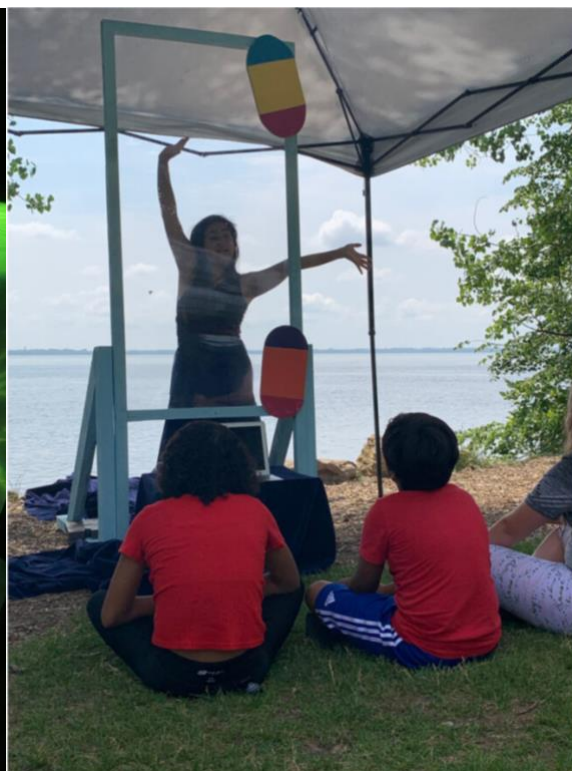
À cœur offert