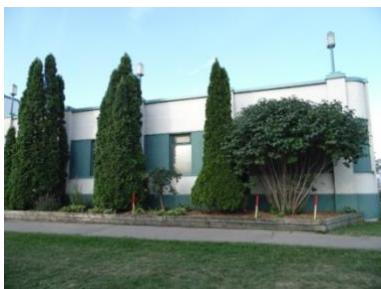
ÉMILE J. LABELLE Architecture Saint-Léonard

Architecture invite les citoyen.ne.s et des nouveaux arrivants de l'arrondissement Saint-Léonard à développer leur regard sur l'architecture de leur quartier et à explorer la photographie en compagnie de l'artiste Emile Jair Labelle. À travers une série d'ateliers, les participant.e.s sont amené.e.s à découvrir la démarche de création d'artistes photographes, mais aussi à développer un regard personnel sur leur quartier à travers leur propre pratique de la photographie. Une projection extérieure permettra ensuite de partager les photographies prises durant les ateliers.