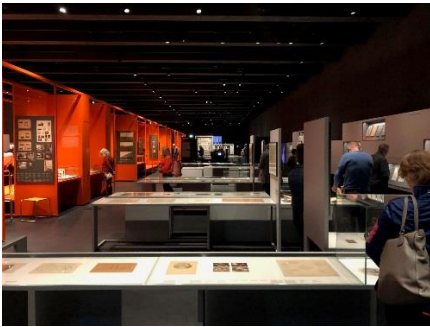
Vue intérieure du Nouveau Musée BAUHAUS