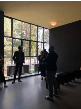
Vue intérieure du studio de Paul Klee