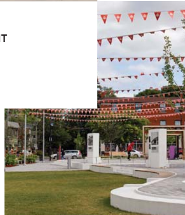
244 SAINT- JACQUES