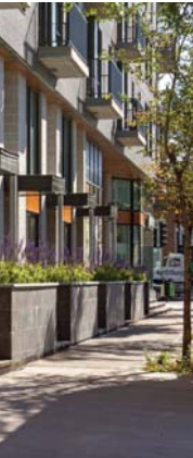
JEAN-TALON / CLARK