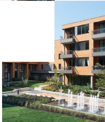
ABORDS DU PONT JACQUES-CARTIER