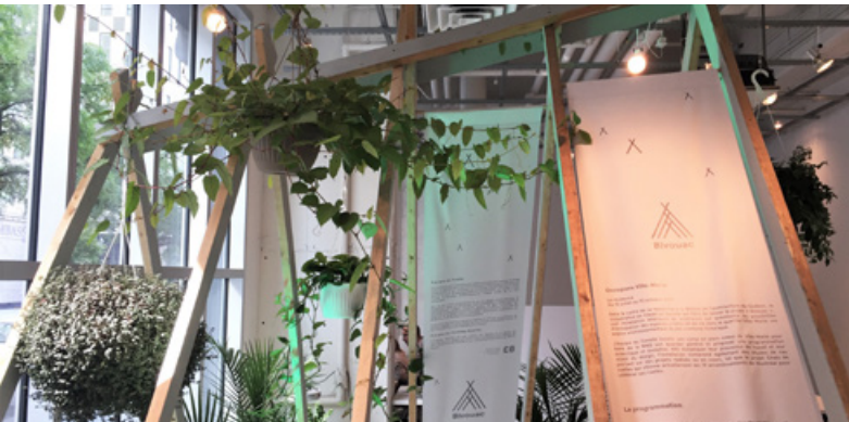
Installation Bivouac, Le Comité

Résidence d'été + Atelier #4 - du 10 juillet au 10 octobre 2017