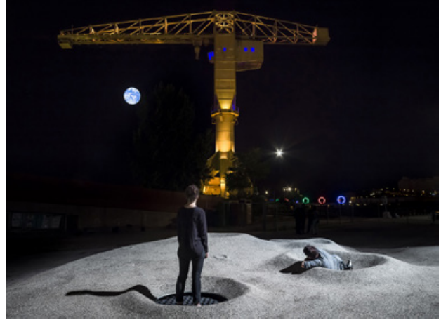
On a marché sur la lune, Detroit Architectes

Plus de détails sur leur projet de résidence