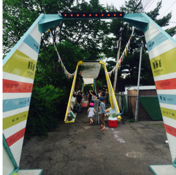
Chats de ruelles

Lire le communiqué de presse de l'atelier