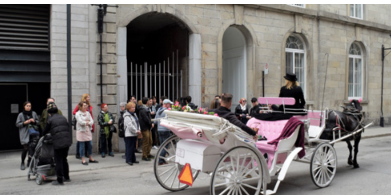
Atelier #2 - Le retour du cheval utilitaire en ville : circuits, usages, aménagements