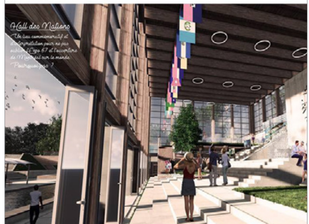
Projet de recherche Particité © STGM Architectes