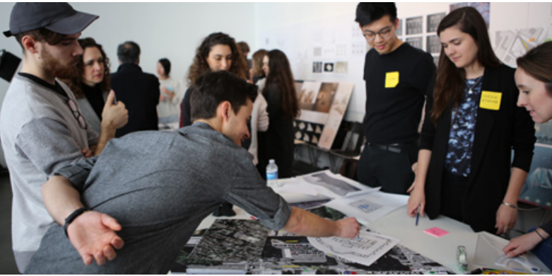
Atelier #1 - Trois sites en folie dans Ville-Marie

Résidence d'hiver + Atelier #1 - du 8 mars au 20 mai 2017