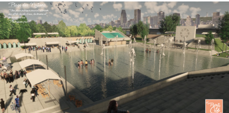
Proposition d'aménagement de la Place des Nations © STGM Architectes

Résidence de printemps + Atelier #3 - du 26 mai au 6 juillet 2017