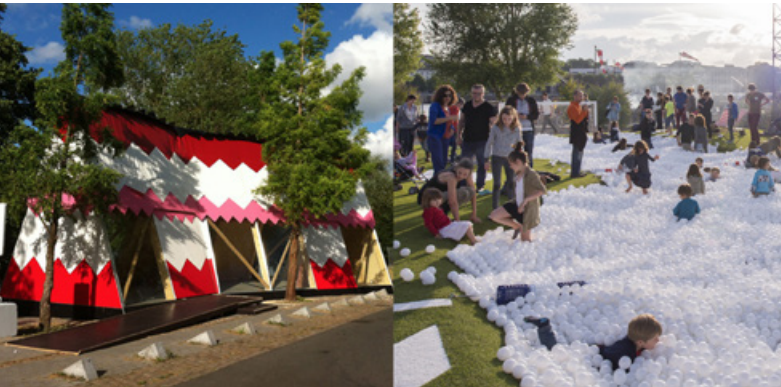
La Canadienne, Fichtre

Résidence d'automne + Atelier #5 - octobre à décembre 2017