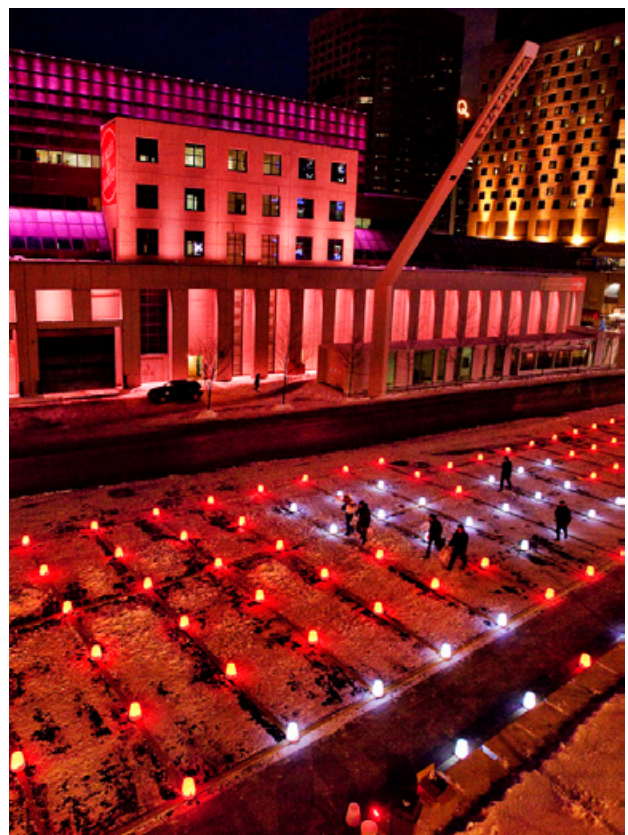
Champ de pixels, Intégral Jean Beaudoin