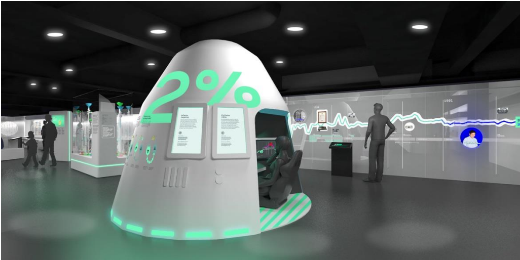
Interactif : « atterrir dans les 2% », Banque du Canada