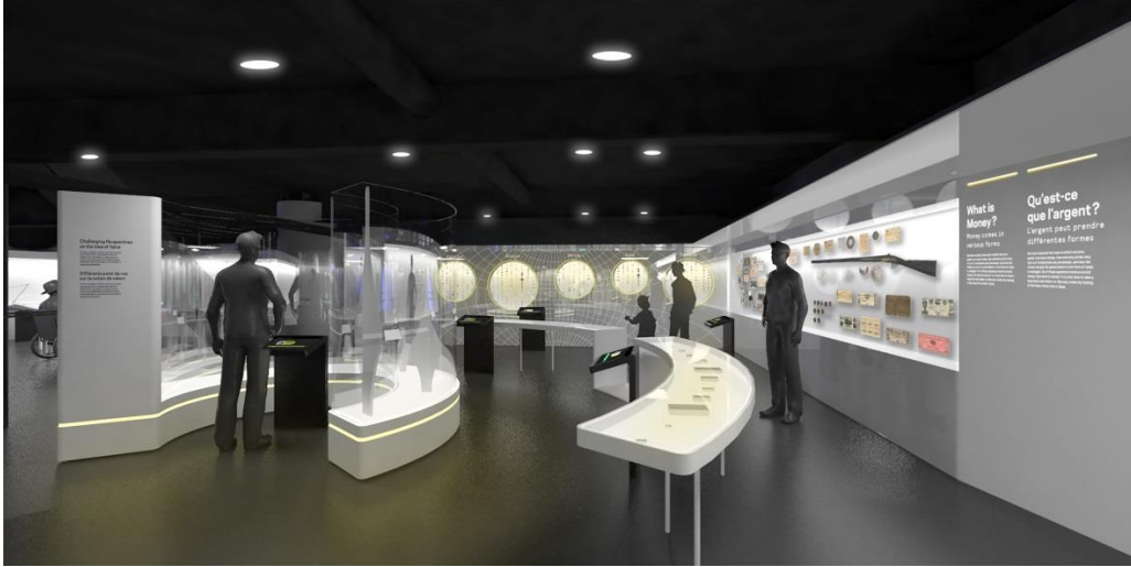
« Qu'est-ce que l'argent? », Banque du Canada