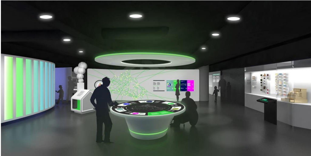
Interactif : « Les individus aident à diriger l'économie », Banque du Canada