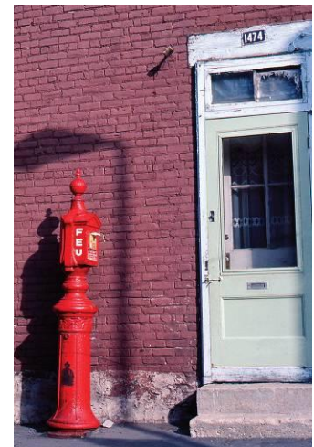
Borne d'alarme à incendie devant le 1474, rue Sainte-Rose, 1978.

« Après une grosse bordée de neige, les rues et fonds de cour se remplissaient parfois jusqu'au deuxième étage. Je me rappelle d'un hiver particulièrement rude où je pouvais descendre du balcon du deuxième étage en glissant jusqu'au premier. Dans certains fonds de cour assez grands, on trouvait parfois de petites patinoires. »