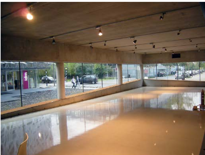
Galerie d'exposition de la Maison régionale de l'architecture de Nantes

Les étapes de déroulement de la résidence sont libres de proposition, toutefois il est souhaitable de proposer des temps de collecte et d'échange, des temps de production partagée, et des temps de présentation. Un temps fort de restitution d'une semaine au moins permettra de partager et de diffuser les travaux de la résidence. Le lauréat pourra s'appuyer sur les mediums qui lui semblent les plus pertinents pour présenter son travail. La MaPdL fournira dès la sélection du candidat la liste des équipements mis à sa disposition pour la restitution finale (support d'affichage, vidéo-projection...). Elle insiste aussi sur la nécessité de produire des éléments de communication qui seront utilisés par le résident pour la diffusion de son travail dans le cadre de manifestations, tables rondes, et autres événements liés à l'architecture en Pays de la Loire.