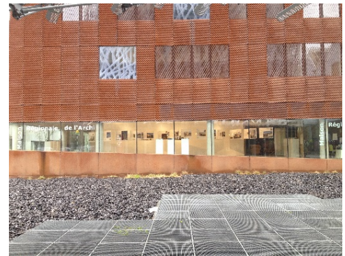
Façade de la MaPdL