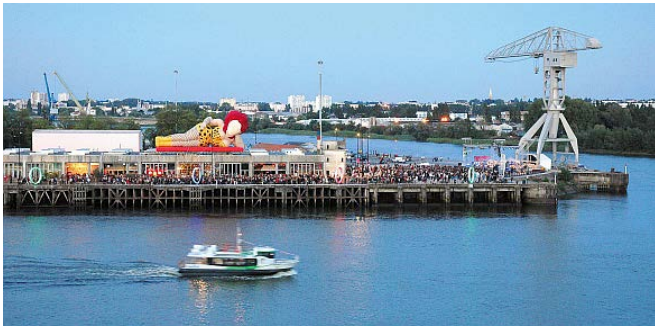
Vues de l'Île de Nantes