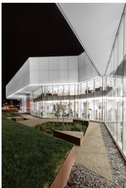
Bibliothèque Saul-Bellow © CHEVALIER MORALES ARCHITECTES